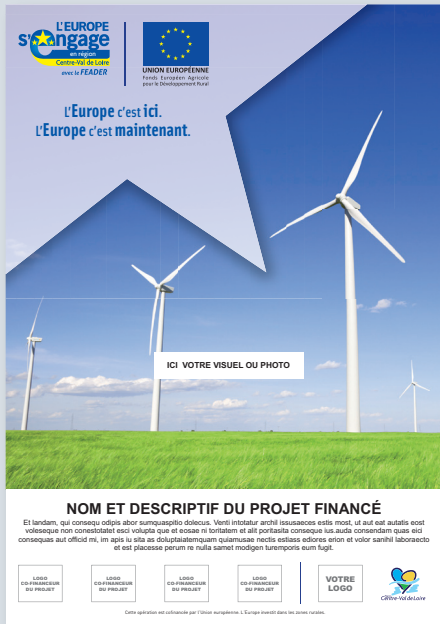
→ Exemple d'affiche (format A3).